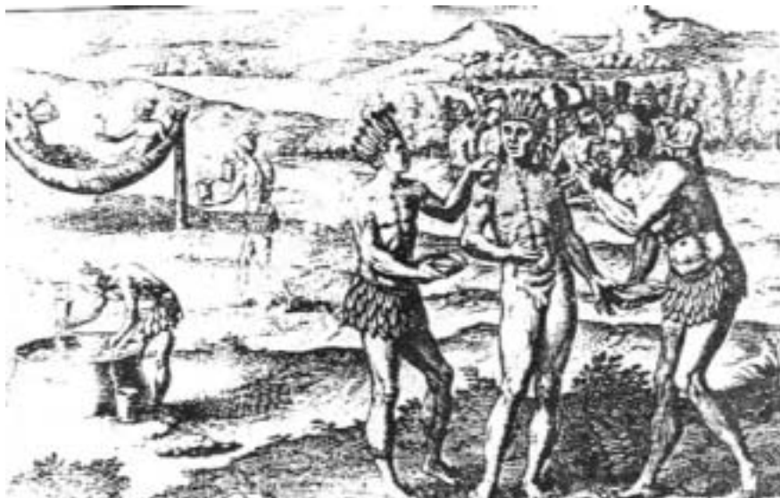
Figura 3: El Dorado (De Bry, 1595), (Biblioteca Nacional, Caracas)