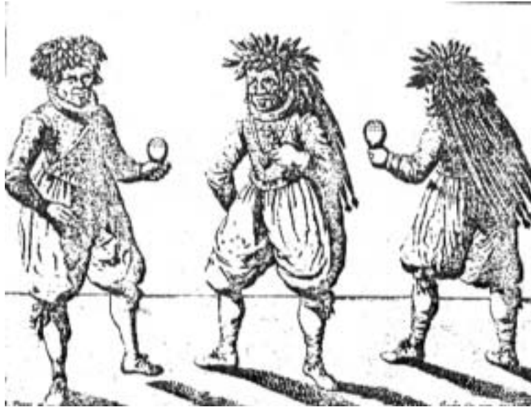
Figura 6: Indios tupinambá con trajes a la moda europea (D'Evreux, 1613) (Ribero, 1990)