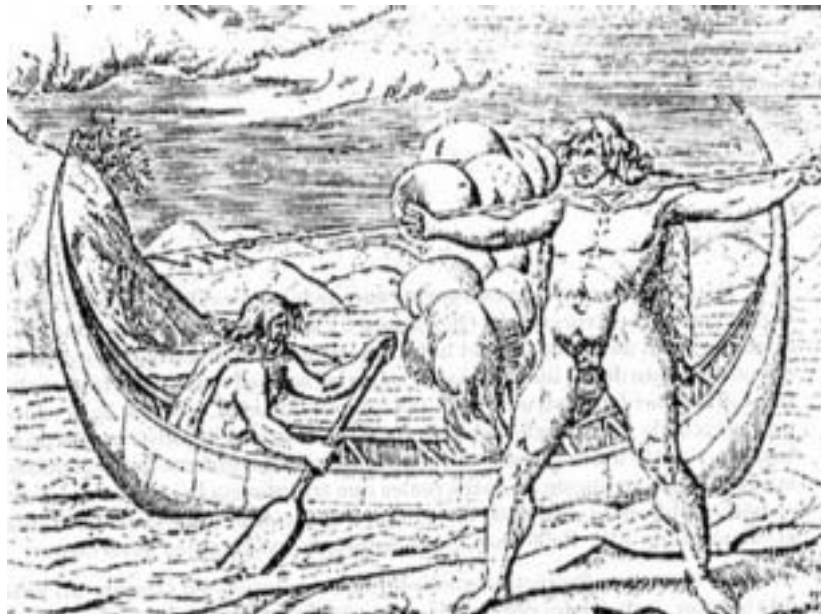
Figura 1: Gigantes de la Patagonia (Sebalt de wert, 1600), (Sebastián 1990)