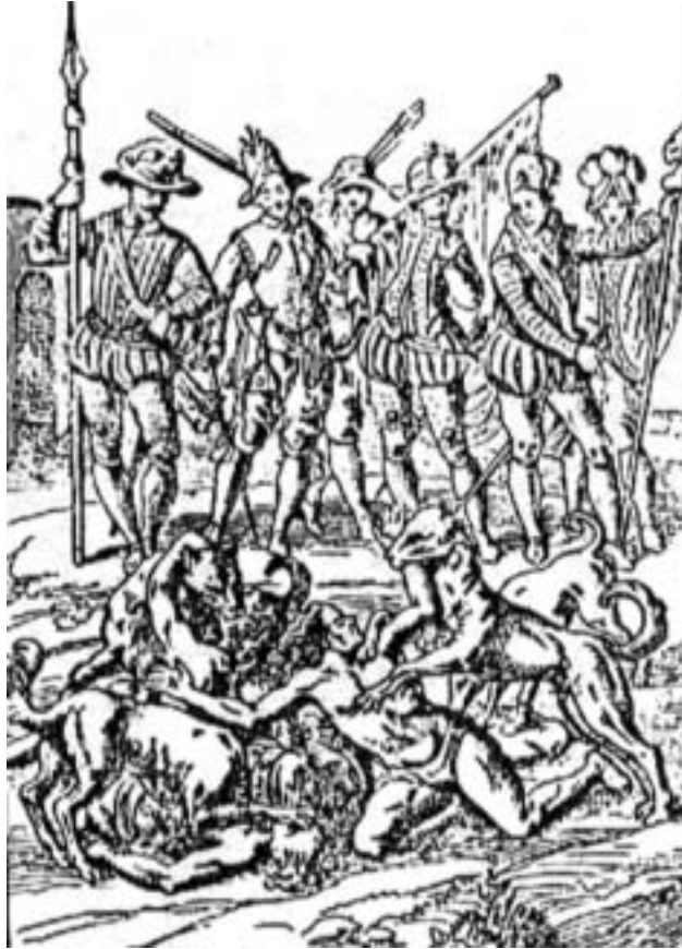
Figura 2: Indios Acusados de sodomía y castigados por Núñez de Balboa (De Bry, 1595), (Uslar Pietri, 1962)