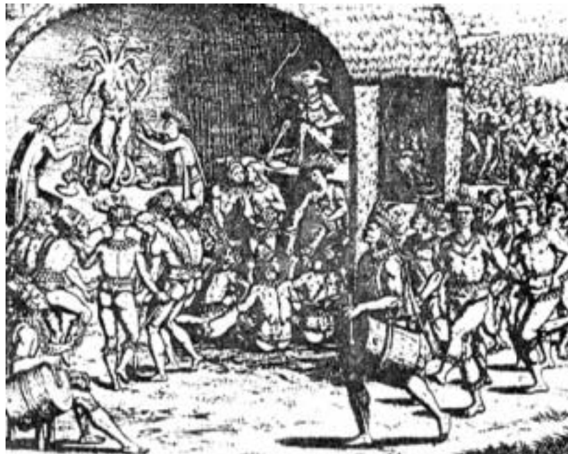
Figura 9: Indios del Perú que adoran al diablo (De Bry, 1594)