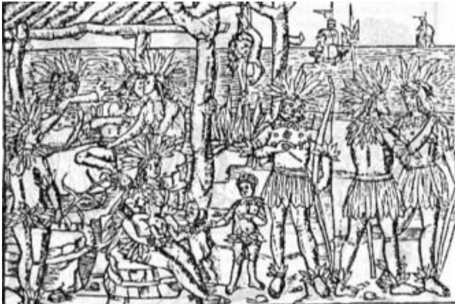
Figura 7: Escena de la vida cotidiana de los caníbales del Brasil (1505), (Lehner, 1966)