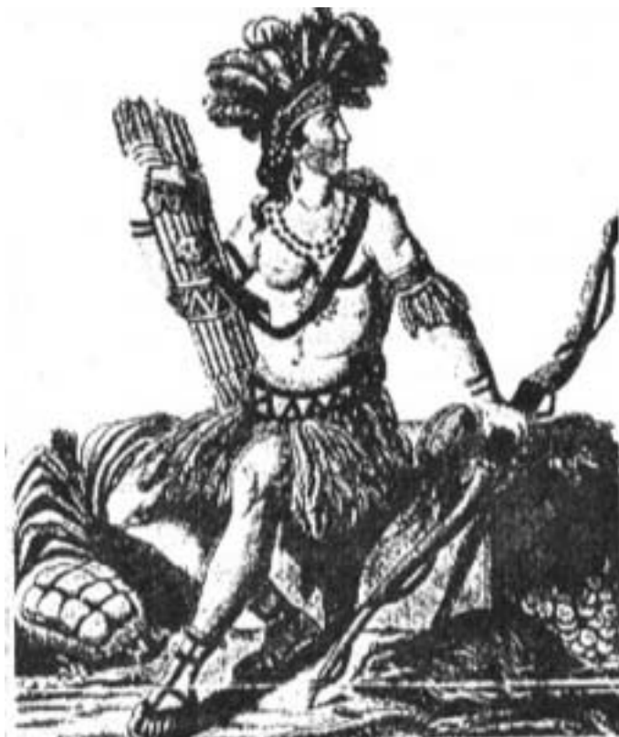
Figura 10: América (Grasset de saint Sauveur), (Gheerbrant, 1989: 39)