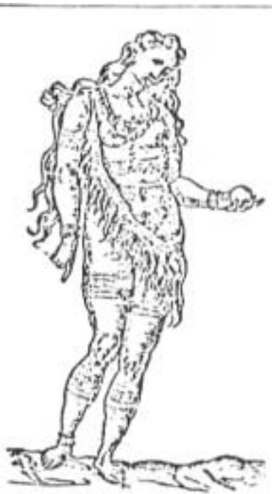
Figura 4: Traje de la Reina, (Vecellio, 1598; 497) "La reina camina adelante con los cabellos sueltos, con muchos collares al cuello, en la espalda y en las piernas; se deleitan mucho pintándose, se cubren la espalda y las partes vergonzosas con hojas de árboles; y en las orejas llevan huesos de peces" (Vecellio, 1598: 498)